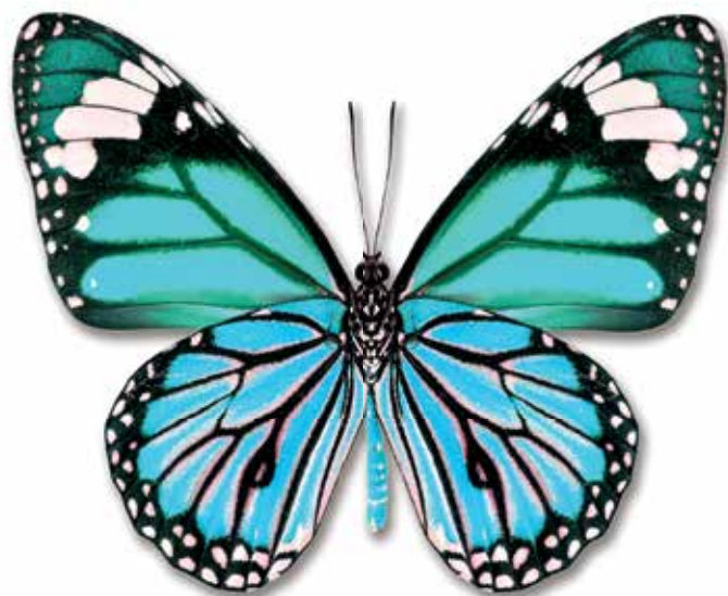
TURQUISA LATICORNUM 1951 - N. 113