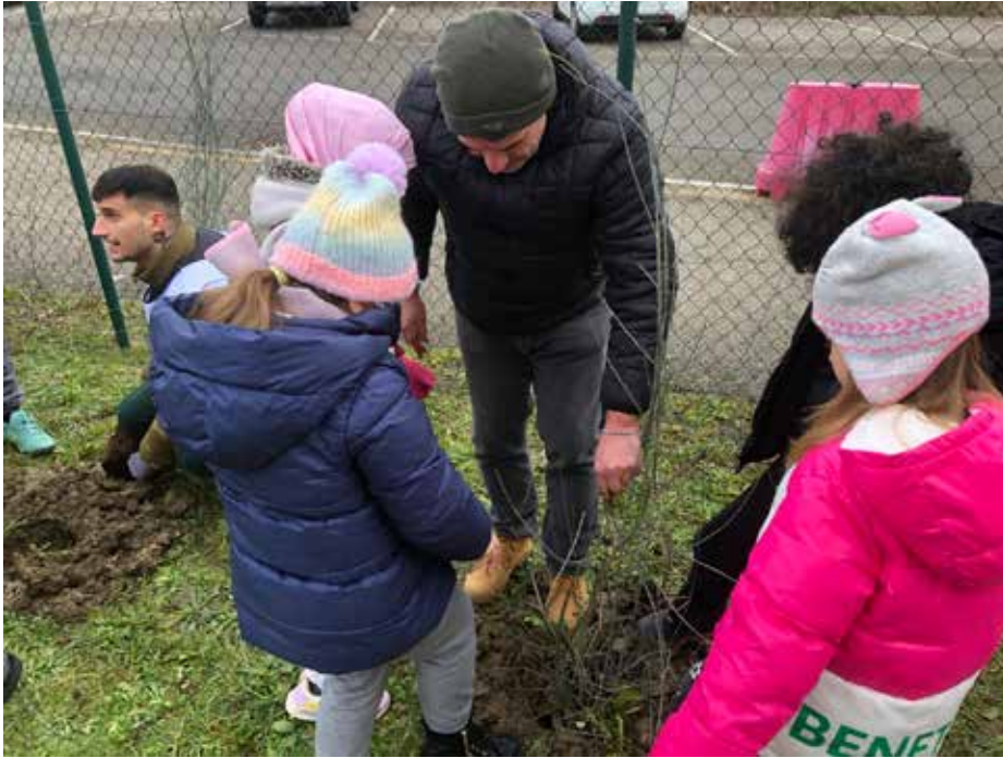
Un momento del progetto "Un albero per il futuro", con gli alunni impegnati a piantumare i nuovi alberi

della tutela dell'ambiente. Ringrazio tutte le istituzioni, le associazioni, i cittadini e i dipendenti del Comune che contribuiscono all'obiettivo di realizzare progetti verdi in paese che garantiscano bellezza e sicurezza. In conclusione vorrei salutare e