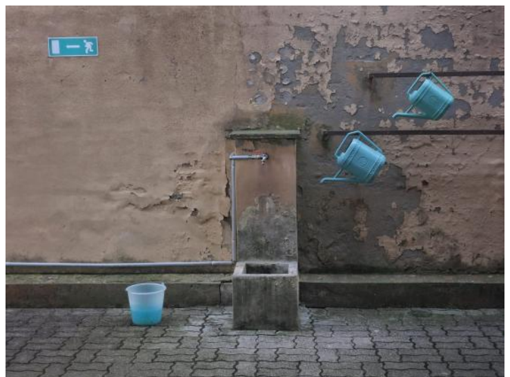
Foto scattata nel nostro cimitero da Fiorenzo Amadelli, appassionato di fotografia.