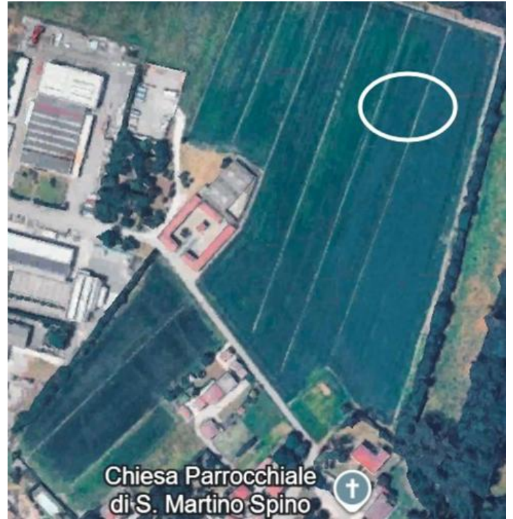
L'area delle ricerche

La terra era stata arata e perlustrandola tutta, nella zona indicata sull'immagine di Google Earth, c'erano tante pietre rotte.