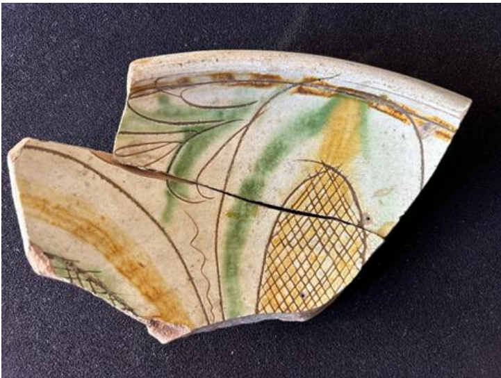
Maiolica interna di piatto - cm. 20

Ho ritrovato in solaio questi reperti, sono i pochi pezzi rimasti di una piccola serie scoperta circa 70 anni fa nel "Beneficio" della parrocchia.