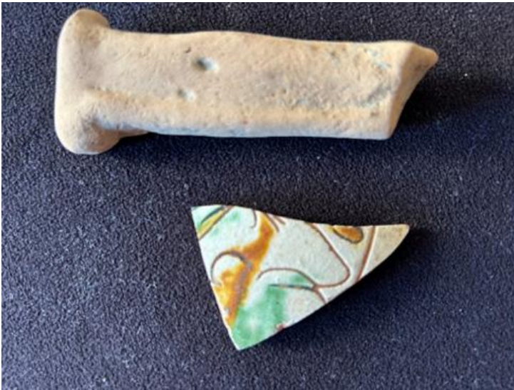
Manico in terracotta e maiolica esterna di vaso